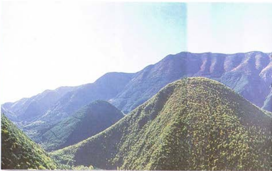
... et aujourd'hui