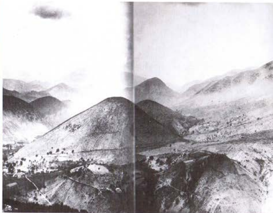
Le Mont Ventoux au début du siècle...